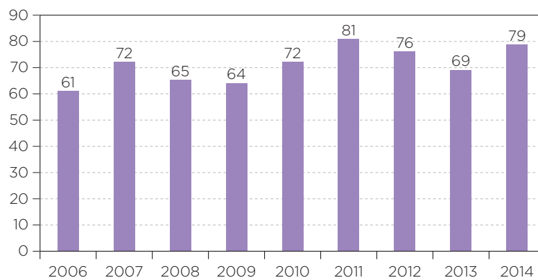
Gráfico 2: Sentencias de inadmisibilidad dictadas en requerimientos de INA, años 2006 a 2014.